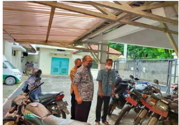
Pelayanan Informasi Ke Bapenda Prov. Jateng Terkait Kendaraan Dinas