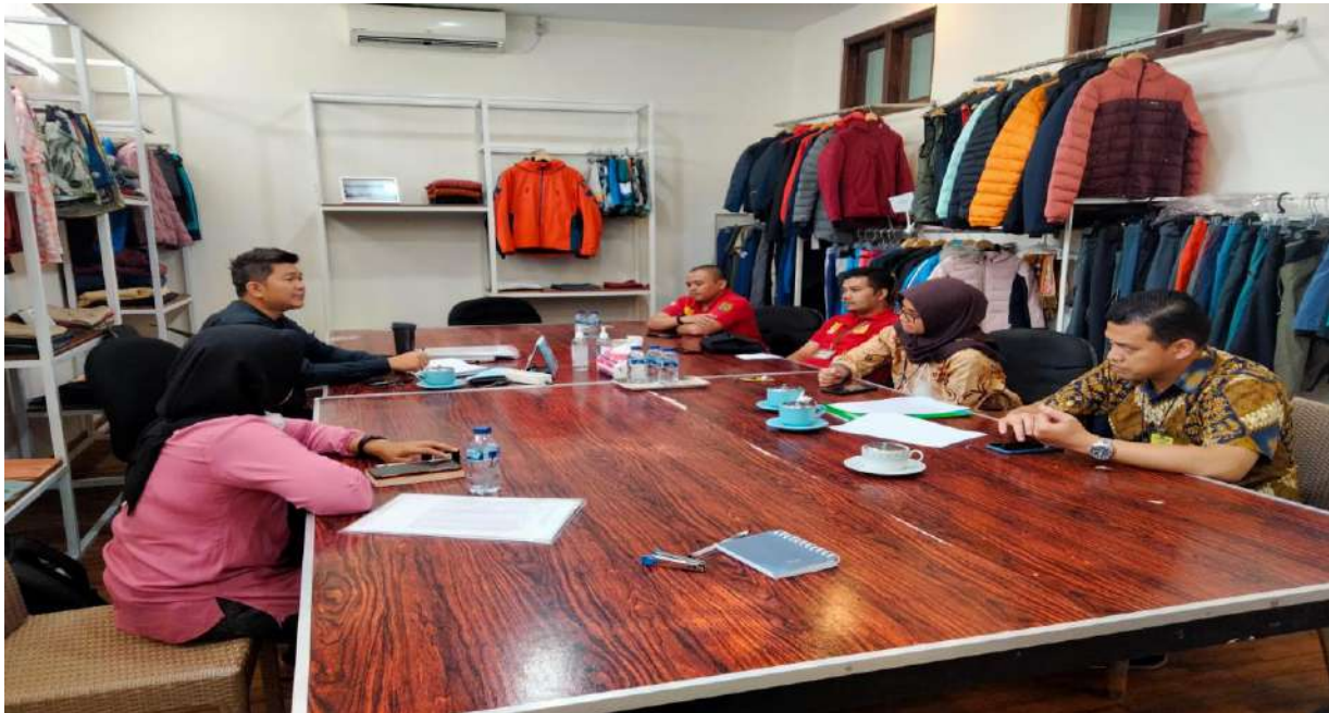
Tanggal 6 Juni 2023, Kegiatan Pembinaan Norma Jaminan Sosial Bersama BPJS Ketenagakerjaan di PT. Republik Kab. Klaten .