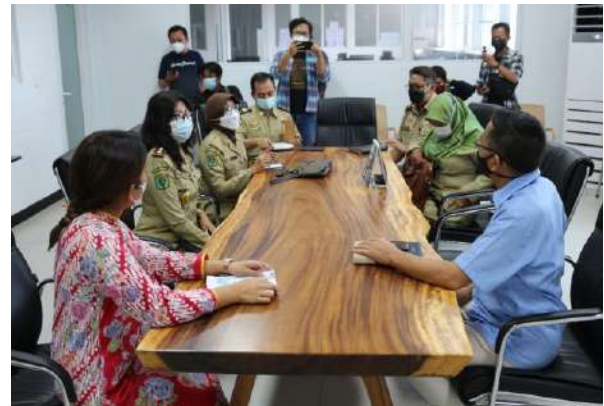
Pelayanan Informasi Ke Karyawan Perusahaan Terkait THR