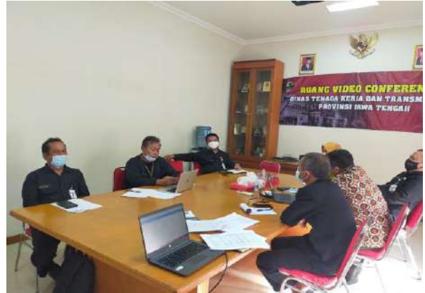
Pelayanan Informasi Ke Biro APBJ Terkait Pengadaan Barang dan Jasa