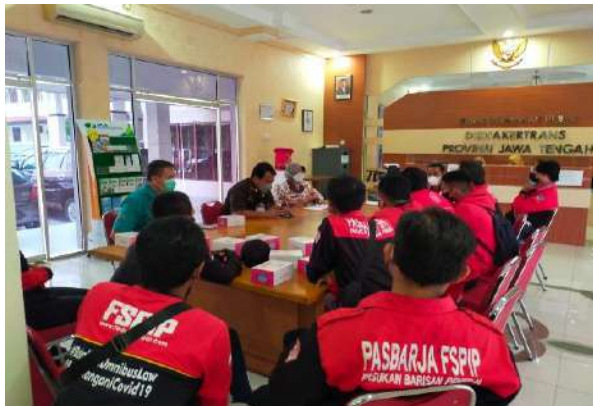
Pelayanan Informasi Ke Serikat Buruh Terkait Upah Minimum