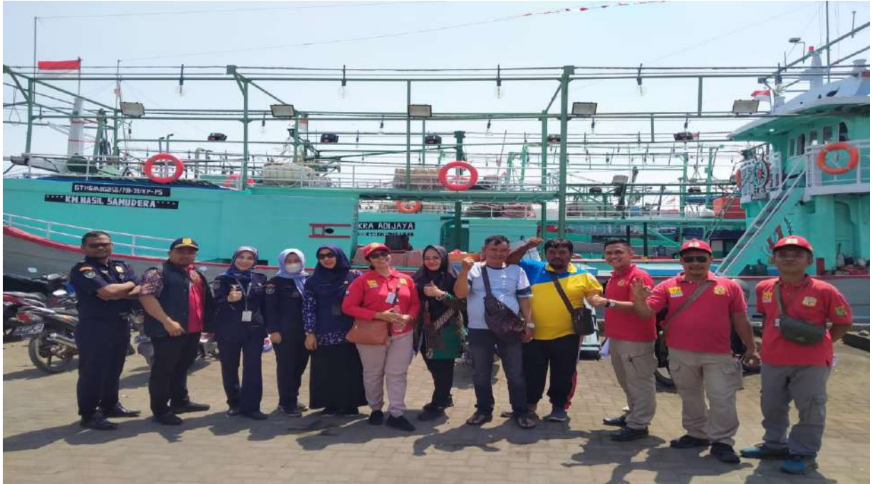
Tanggal 9 Agustus 2023, Kegiatan Pengawasan Bersama dengan Dinas Kelautan dan Perikanan terhadap kapal Perikanan di Pelabuhan Tegal.