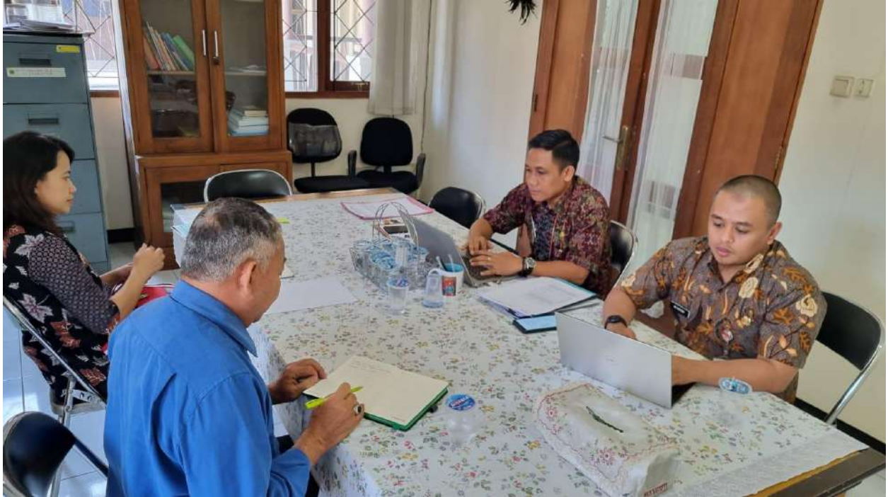
Tanggal 23 Mei 2023, Tindak Lanjut Penanganan Aduan THR Keagamaan Tahun 2023.