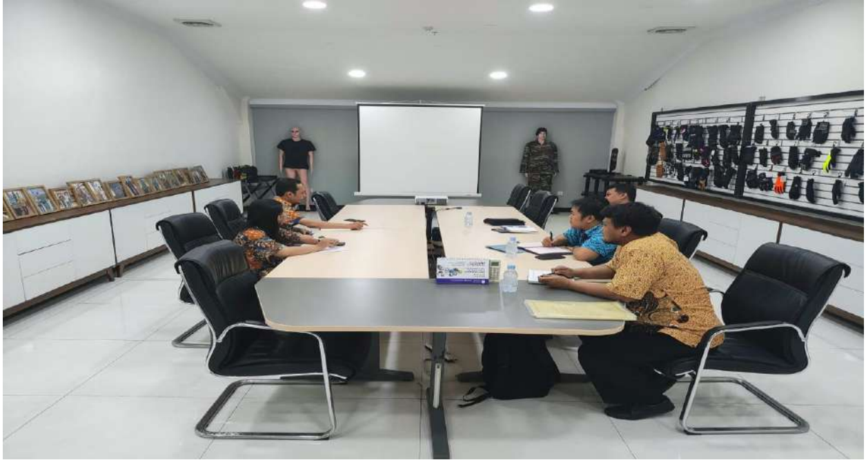
Tanggal 18 Juli 2023, Kegiatan Pembinaan Ketenagakerjaan di PT. JJ Glove Kab Klaten.