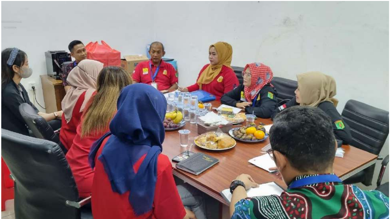
Tanggal 13 September 2023, Penanganan Kasus Ketenagakerjaan di PT. Heng Xuang Internasional Kab. Rembang bersama Pengawas Ketenagakerjaan Kemnaker RI.