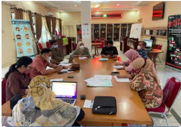
Pelayanan Informasi Ke Perusahaan Terkait Aplikasi Lowongan Kerja Pemprov Jateng