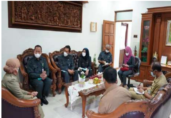
Pelayanan Informasi Ke BPS Terkait Data Ketenagakerjaan