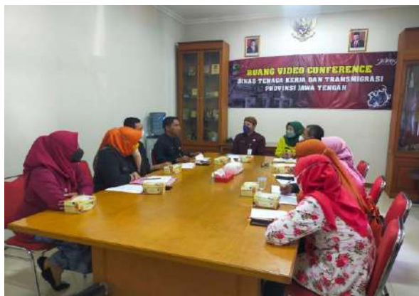
Pelayanan Informasi Ke BPKAD Prov. Jateng Terkait Aset Disnakertrans Prov. Jateng