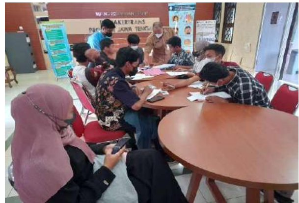
Pelayanan Informasi Ke Masyarakat Terkait Magang Jepang